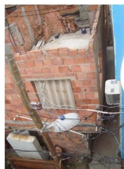
1, 2, 3. Parcours de fils artisanaux, de la résidence au transformateur