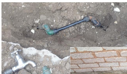
7, 8. Mise en place du conduit de raccordement artisanal