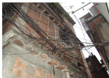
Concentration de branchements